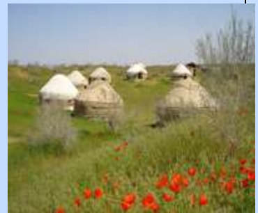
Hébergement dans des yourtes.