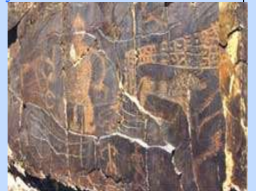
Le Sarmysh fameux